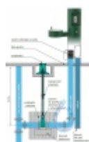
Zawór odwadniający 3/4 " z żeliwa sferoidalnego + obudowa + skrzynka - zestaw 196.960.364